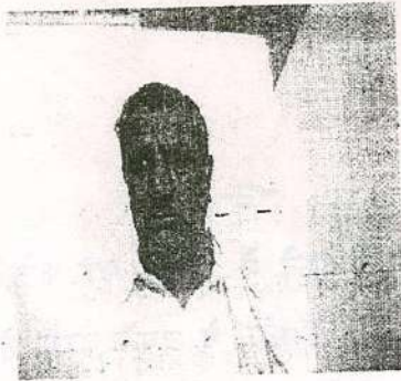
पट्टा लेने वाला