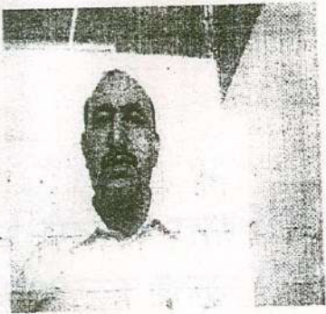
पट्टा देने वाला